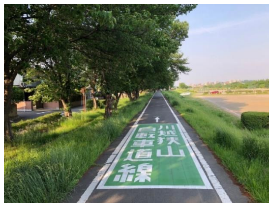
入間川サイクリングロード