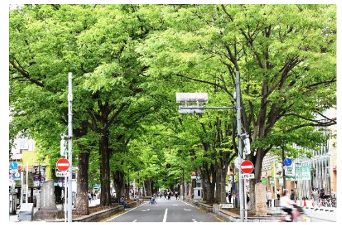
馬場大門ケヤキ並木