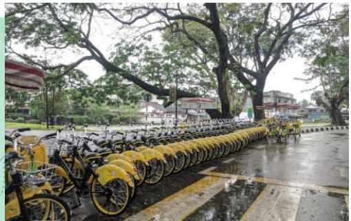
利用予定のレンタサイクル 【無変速シティサイクル(ママチャリ)】