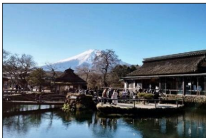
[ 忍野八海 湧池 2021/10 ]