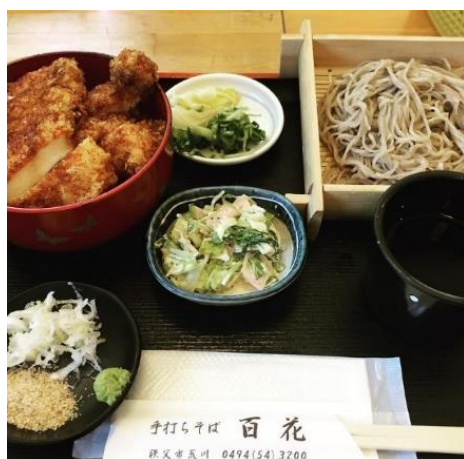
ランチ「手打ちそば百花」