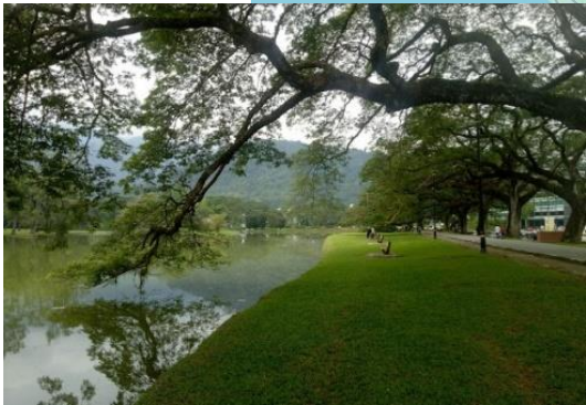
タイピンレイクガーデン