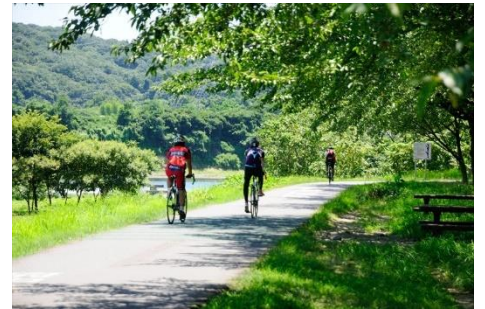
府中多摩川かぜのみち

★サイクリング (Hello Cycling を利用予定) 「府中多摩川かぜのみち」(多摩サイの府中市部分)の一部をサイクリング。