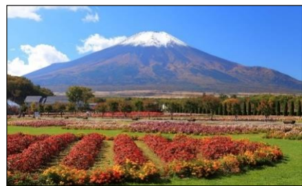
[ 花の都公園 2021/10 ]