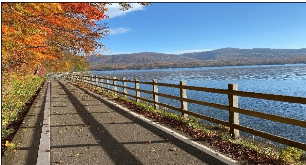
[ 山中湖湖畔の紅葉北側自転車道 2021/10 ]