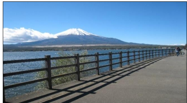
[ 山中湖自転車道(北側)からの富士山 2021/10 ]