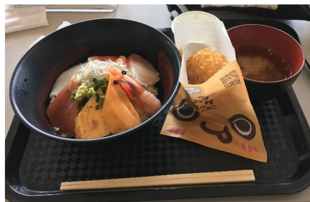
生しらす丼推奨（これは海鮮丼）