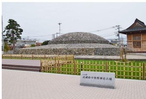
武蔵府中熊野神社古墳